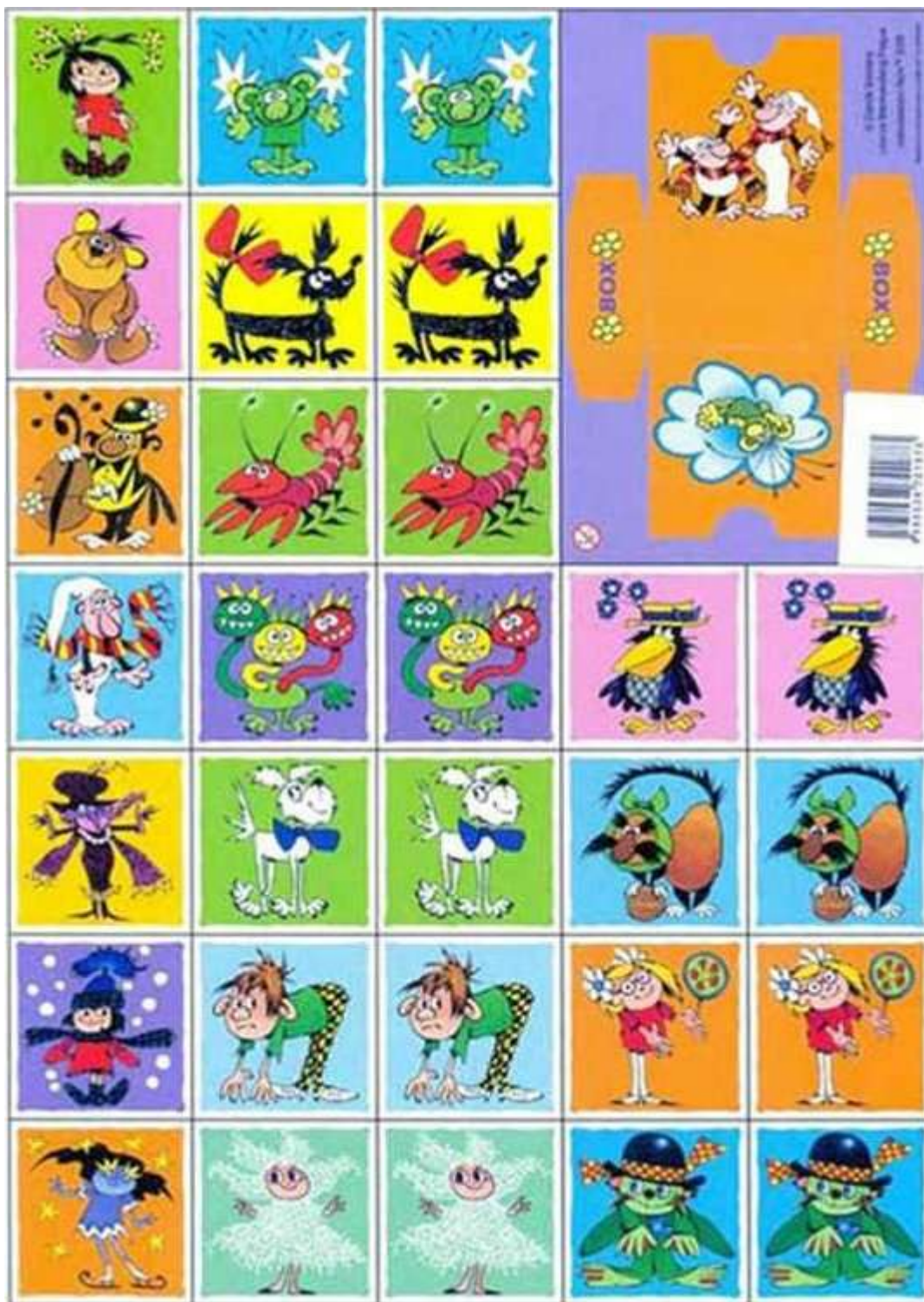
A malé pexeso nakonec